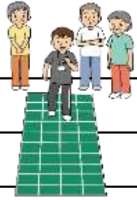
*スクエアステップ*